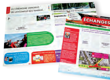
Communauté d'agglomération de Marne et Gandoire – lettre Échanges