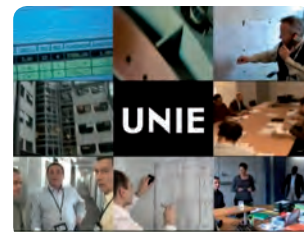
EDF – film institutionnel Les missions de l'Unie