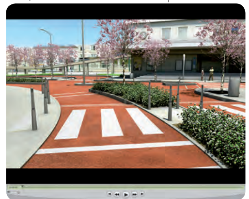
Communauté d'agglomération de Marne et Gondoire – animation 3D ultra-réaliste