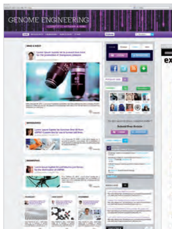
Collectis – Genome engineering – plateforme