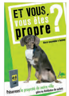
Ville d'Aulnay-sous-bois – campagne citoyenne