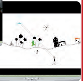
Eligeo – animation 2D