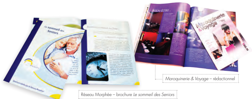
Réseau Morphée – brochure Le sommeil des Seniors