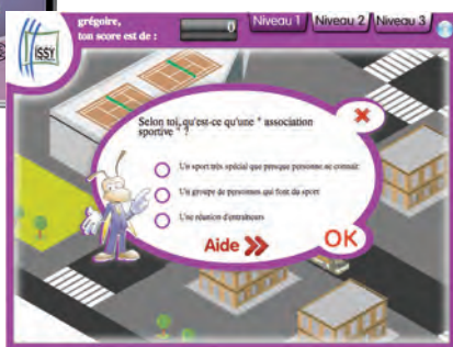
Ville d'Issy-les-Moulineaux – serious game

Adverbia agence de communication publique et corporate