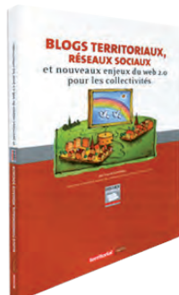
Franck Confino est l'auteur du premier livre collaboratif consacré aux blogs publics : Blogs territoriaux, réseaux sociaux et nouveaux enjeux du web 2.0 pour les collectivités territoriales (Éditions Territorial, 2010)