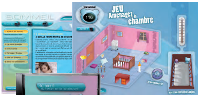
Académie de Paris, UNAF, INPES et Réseau Morphée – DVD Sommeil de l'enfant et de l'adolescent