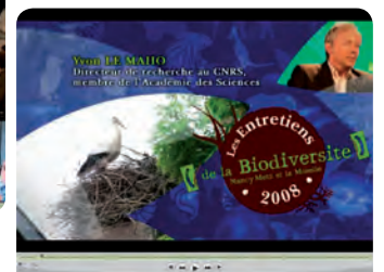
Entretiens de la biodiversité – captation et montage de l'événement