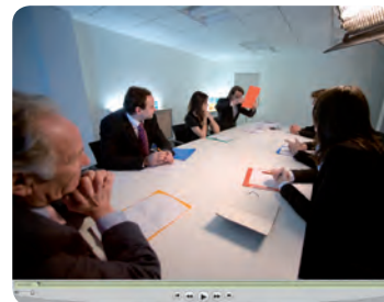
GSM consulting – campagne publicitaire