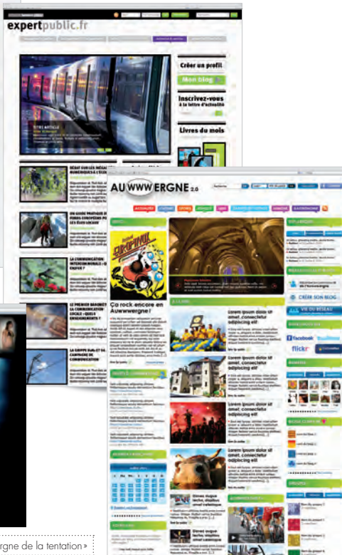
Conseil régional d'Auvergne – auwwwergne