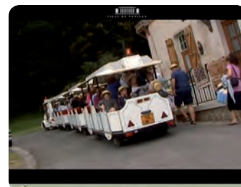
Ville de Puteaux – captation et montage des événements