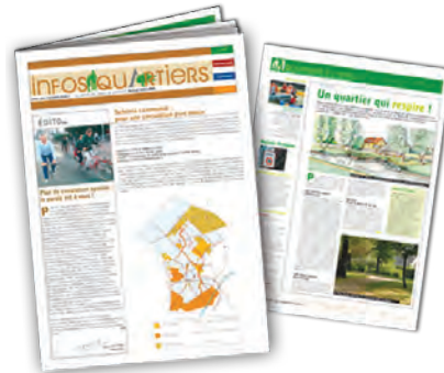
Ville d'Aulnay-sous-bois – journal Infos quartiers